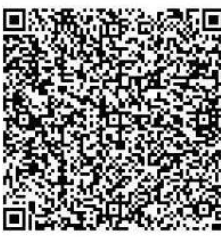
จังหวัดสมุทรปราการ