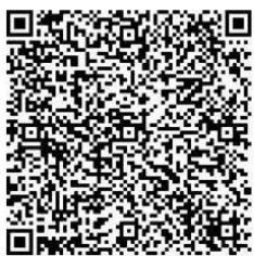
จังหวัดชลบุรี

๔. สำเนาหน้าหนังสือรับรองบุคคล (CI) เล่มใหม่ พร้อมสำเนาหน้าวีซ่าที่ได้รับการ การตรวจลงตราใหม่ถึง ๑๓ ก.พ.๖๖