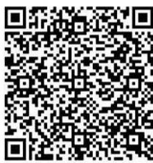
จังหวัดระนอง