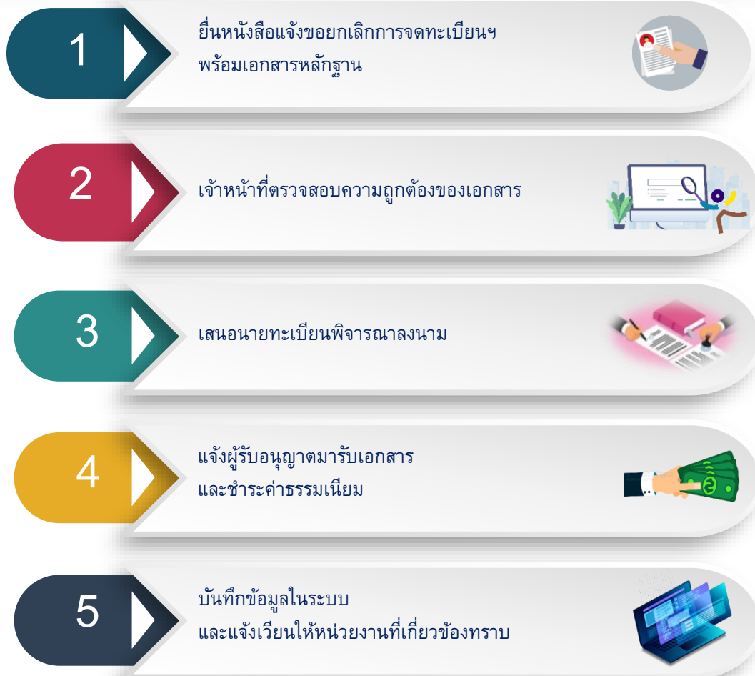
ภาพที่ ๕ ขั้นตอนการยกเลิกการจดทะเบียนลูกจ้าง/ตัวแทนจัดหางานและคืนบัตรประจำตัว